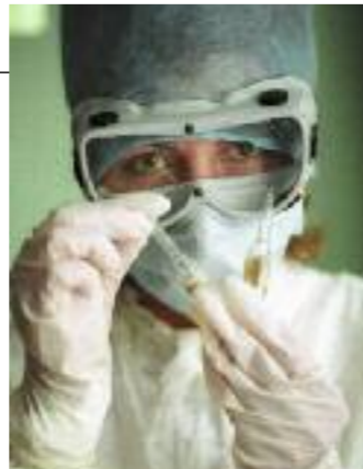
De los tres virus de la gripe (A, B y C), el A es el más virulento.

Una vacuna permanente; aunque, de momento, sólo ha dado resultado en ratones.