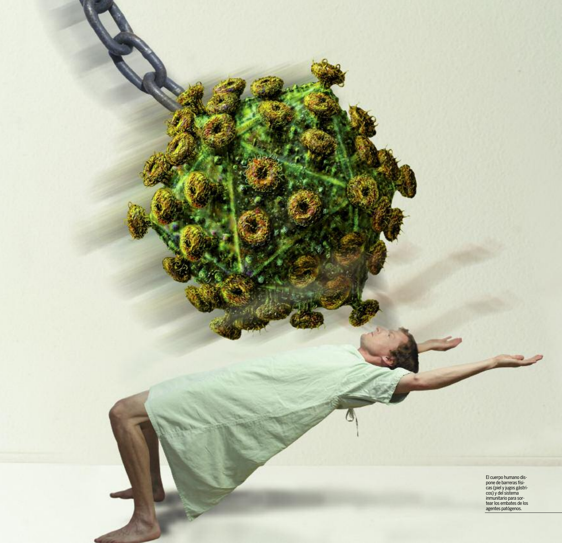
El cuerpo humano dispone de barreras físicas (piel y jugos gástricos) y del sistema inmunitario para sortear los embates de los agentes patógenos.