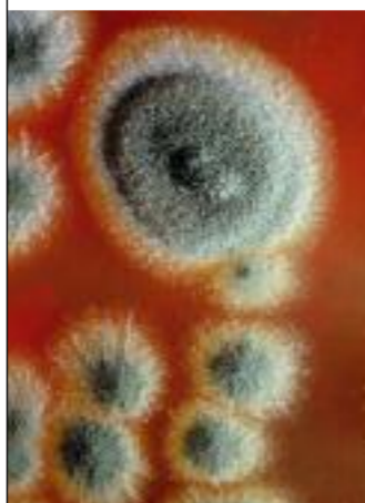
El 15% de los pacientes en una Unidad de Cuidados Intensivos se contagia de hongos patógenos.