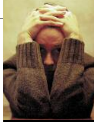
La depresión será la segunda causa de discapacidad en 2020.

Un estudio de la UE realizado en varios países de la Unión investiga 800 genes, para conocer cuáles están implicados en la depresión.